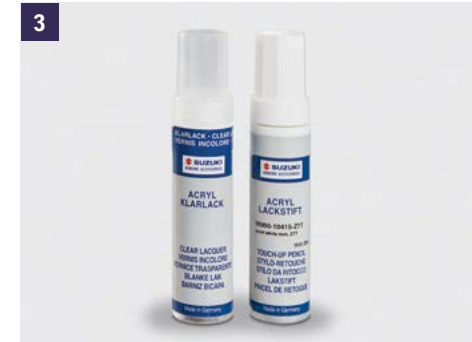
3 | Pincel de Retoque Marrón Canyon Perlado Metalizado Ref. 99000-10415-ZQ3 Azul Sphere Pearlado Ref. 99000-10415-ZQ4 Rojo Energetic Pearlado Ref. 99000-10415-ZQ5 Blanco Ref. 99000-10315-26U Blanco Frío Pearlado Ref. 99000-10415-ZNL Negro Cosmic Pearlado Metalizado Ref. 99000-10415-ZCE Plata Metalizado 2 Ref. 99000-10415-ZCC Gris Premium Titan Oscuro Ref. 9925D-B0100-ZZZ