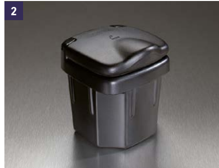
2 | Cenicero Ref. 89810-86G10-5PK