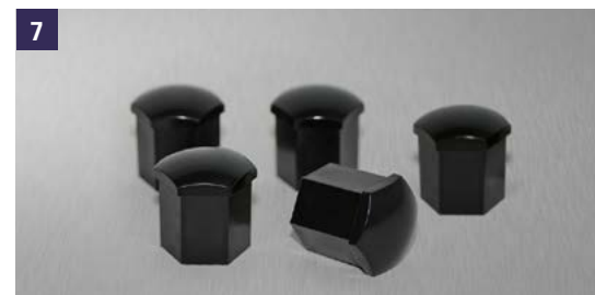
7 | Tapones Tuercas Negras, juego de 5 piezas para una rueda. Ref. 990E0-61M70-COV