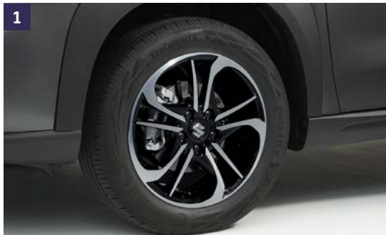
1 | Llanta "MOJAVE" WVTA Negro Pulido, 6.5 J x 17" para neumáticos 215/55 R17, incluye tapa central con logo S. Ref. 43210-54PU1-OSP