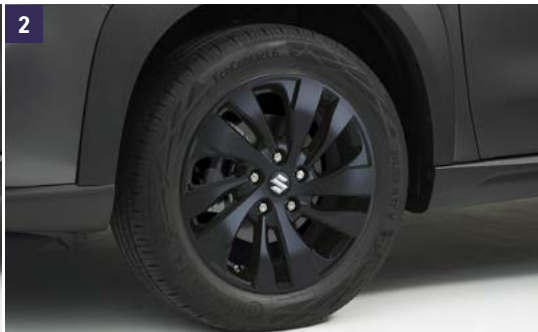
2 | Llanta Negra "17" WVTA Negro brillante 6.5 J x 17" para neumáticos 215/55R17, la tapa central no está incluida. Ref. 43210-64RF0-OCE