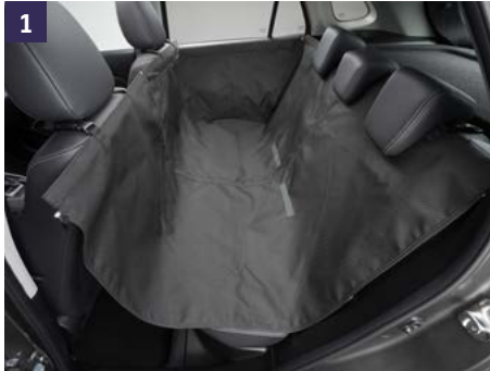
1 | Protector Asientos Mascotas 1 Protege los asientos de los arañazos y suciedad. Ref. 990E0-78R44-000