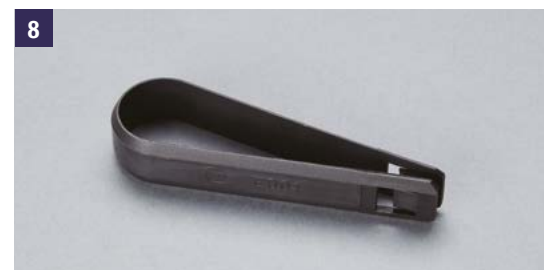
8 | Herramienta Herramienta para tapones de tuerca. (Ref. 990E0-61M70-COV). Ref. 990E0-61M70-PUL