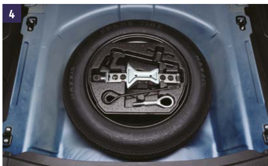
4 | Kit Rueda de Repuesto Para una correcta instalación son necesarios los siguientes artículos 4-1, 4-2, y 4-3.