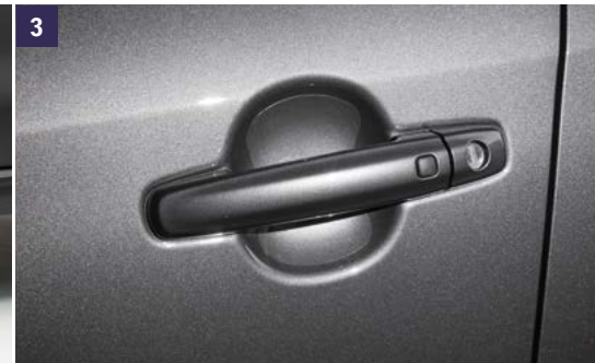
3 | Protector Manilla Puerta Transparente, protege contra arañazos. Juego de 4 piezas. Ref. 99126-57T01-000