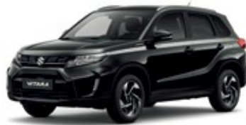
Negro Cósmico Perlado Metalizado