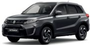
Gris Oscuro Titán Perlado Metalizado