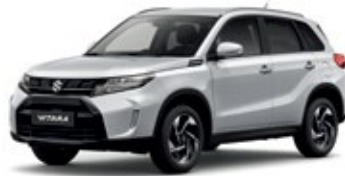
Plata Seda Metalizado