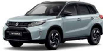
Gris Azulado Metalizado / Negro Cósmico Perlado Metalizado