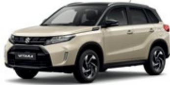
Marfil Sabana Metalizado / Negro Cósmico Perlado Metalizado