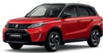
Rojo Bright / Negro Cósmico Perlado Metalizado