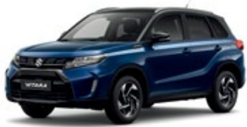
Azul Esfera Perlado / Negro Cósmico Perlado Metalizado