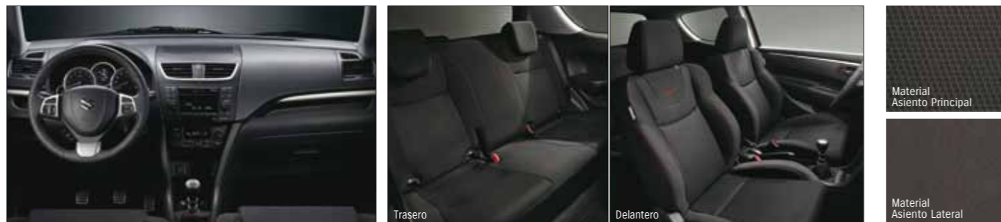
Material Asiento Principal