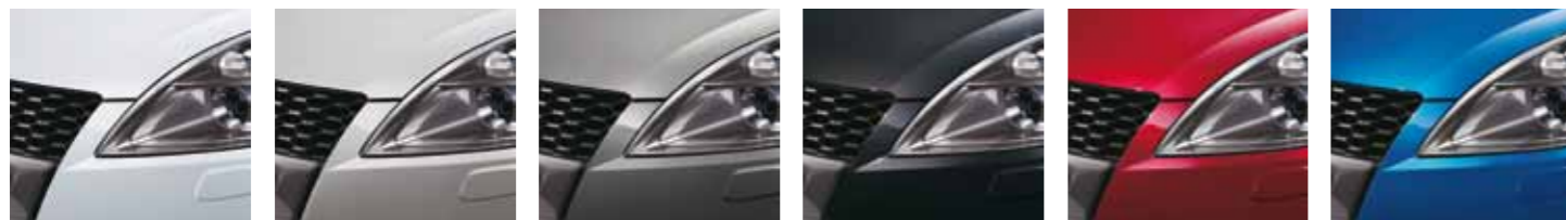
Blanco Perlado (ZNL)