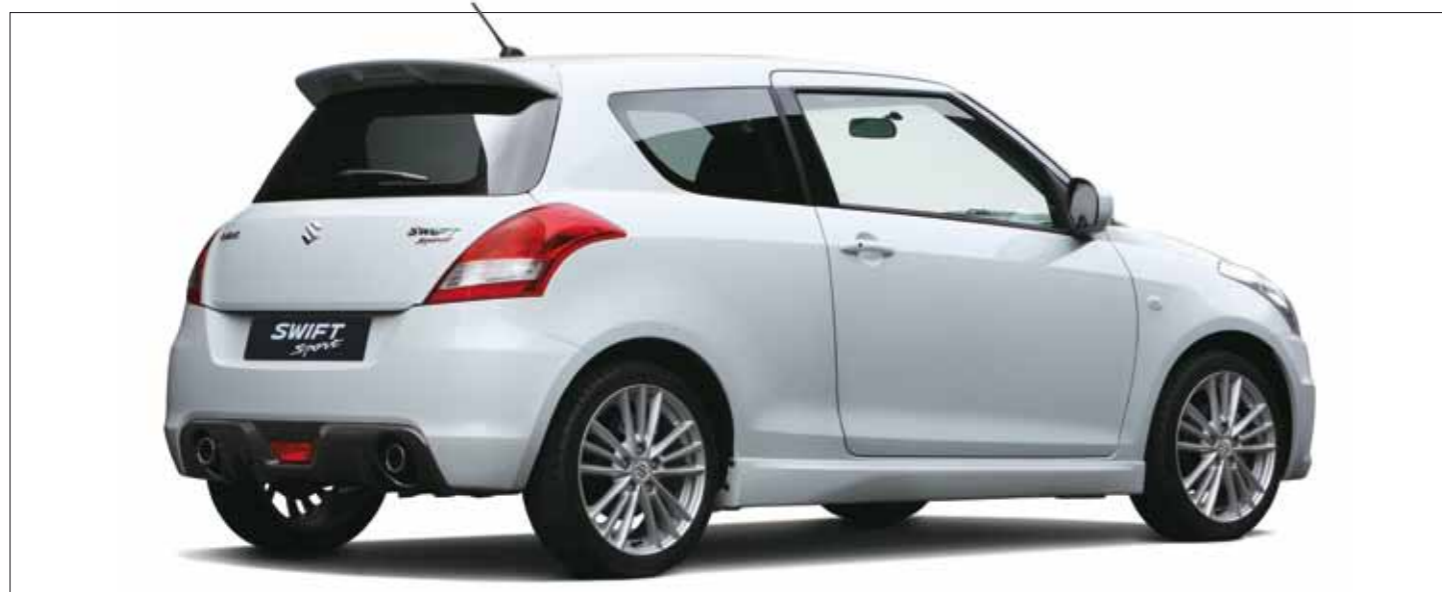
Color Exterior: Blanco Perlado (ZNL)