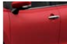
Rojo Fuego (Z4Q)