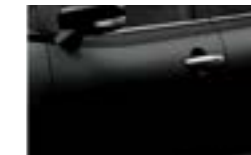
Negro Cósmico Perlado (ZAM)