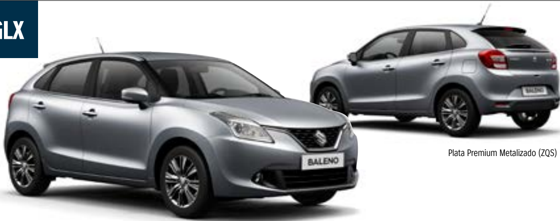
Plata Premium Metalizado (ZQS)