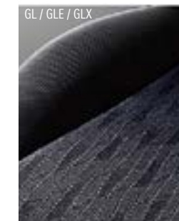
GL / GLE / GLX