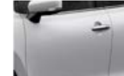
Blanco Superior (26U)