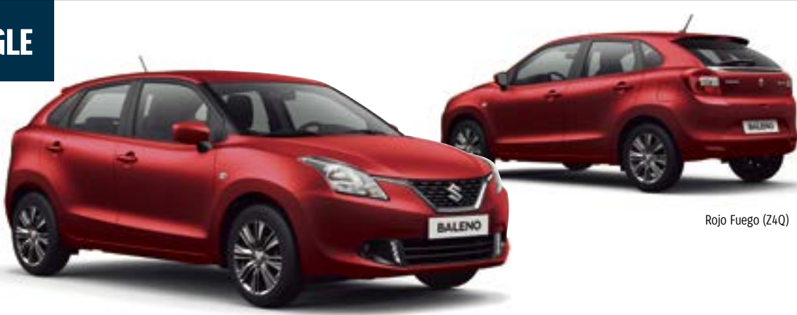
Rojo Fuego (Z4Q)