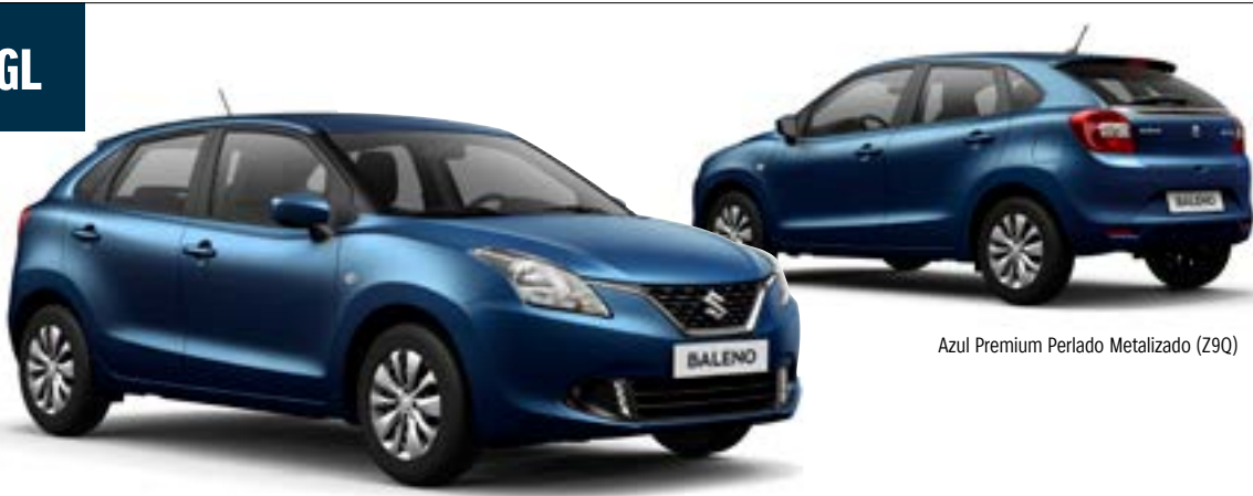
Azul Premium Perlado Metalizado (Z9Q)