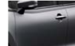
Gris Brillante Metalizado (ZNZ)