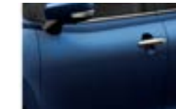
Azul Stargaze Perlado Metalizado (ZYR)