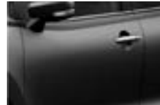
Gris Granito Metalizado (ZTN)