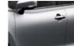
Plata Premium Metalizado (ZQS)