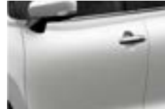
Blanco Ártico Perlado Metalizado (ZHI)