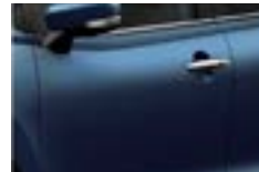
Azul Premium Perlado Metalizado (Z9Q)