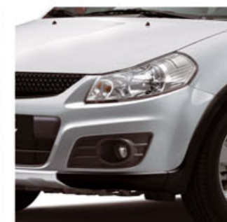
Plata Seda Metalizado 2 (ZCC)