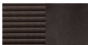
Tela (gris claro + negro)