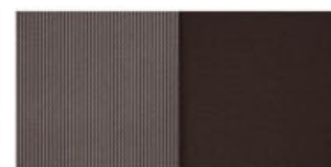
Tela (plata + negro)