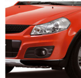
Cobre Perla Metalizado (ZFS)