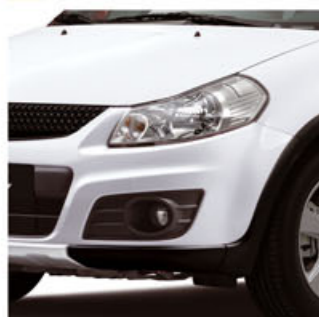
Blanco Superior (26U)