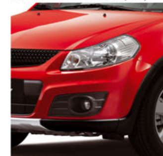
Rojo Bright (ZCF)