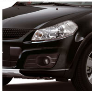
Negro Cósmico Metalizado Perlado (ZCE)