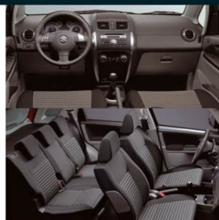
Combinación interior gris oscuro + gris claro (bitono) con asientos de tela plata + negro