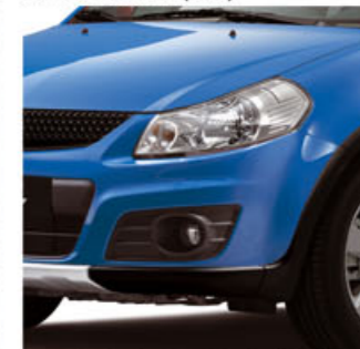
Azul Kashmir Metalizado (ZCG)